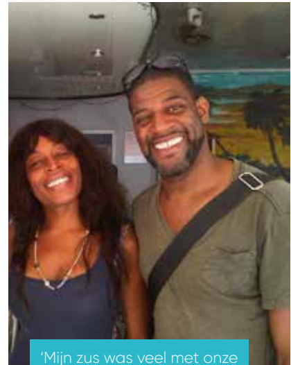
'Mijn zus was veel met onze familie bezig'.

ongrijpbaar zijn, waar ik zelf geen grip op heb. Dan doe ik mezelf tekort.' ■